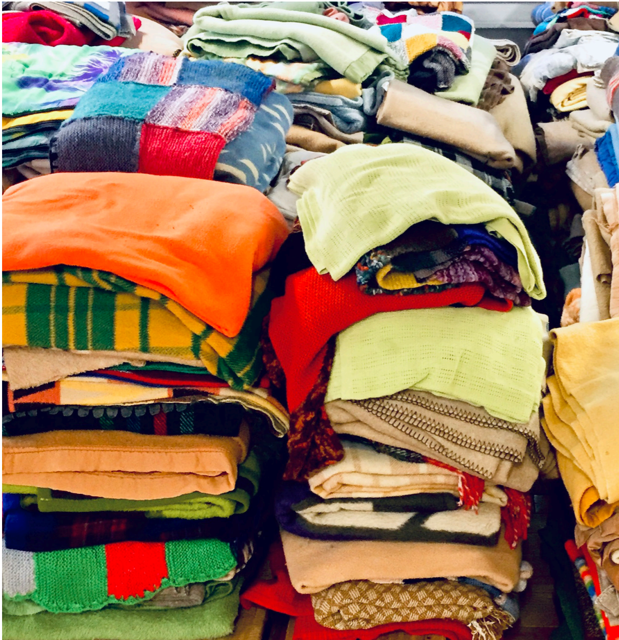
14 tonnes de couvertures ont été lavées par la buanderie de l'EVAM durant l'édition 2020/2021.

Répit, nom masculin : arrêt d'une chose pénible ; temps pendant lequel on cesse d'être menacé ou accablé par elle.