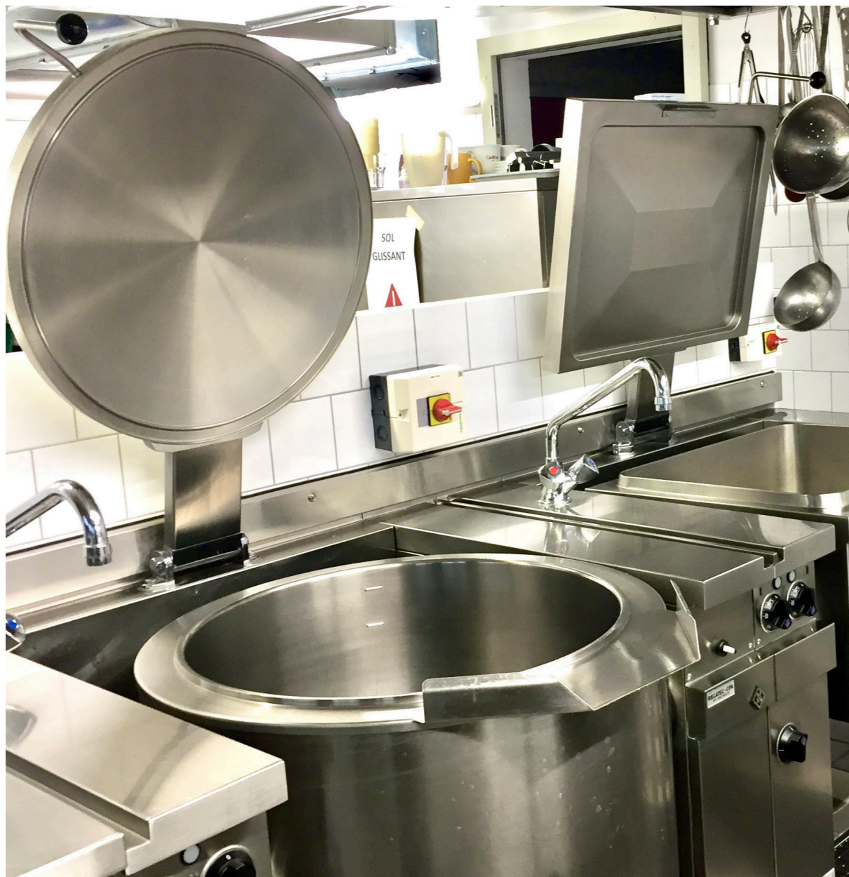
Des équipements flambants neufs pour une cuisine sans cesse renouvelée!

Soupe, nom féminin : potage ou bouillon épaissi composés de légumes et légumineuses cuits auxquels on peut ajouter divers compléments.